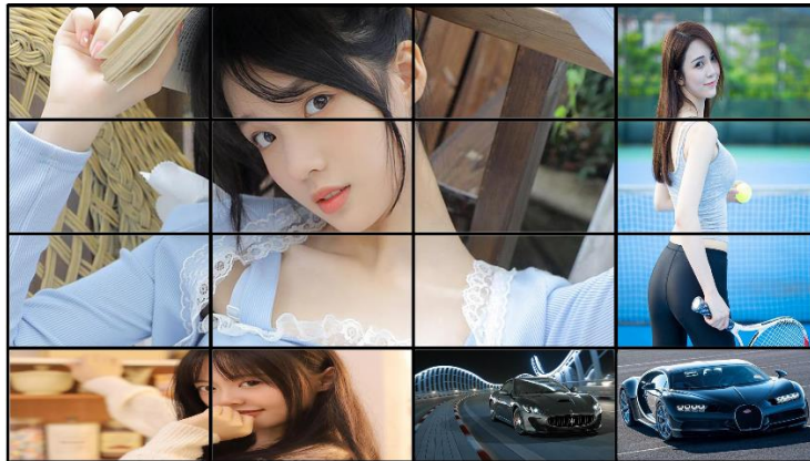
多路信号上墙任意拼接

在一个拼接墙上可以实现任意 NXM 画面的拼接，实现多个信号源之间任意无缝切换。任意几个小屏幕 NXM 拼接。