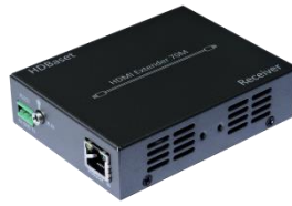
HDBaseT to HDMI Receiver RX x 1pcs