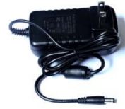
DC12V 3A Power supply X 1pcs