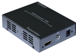
HDMI to HDBaseT Sender TX x 1pcs