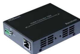
HDBaset 转 HDMI RX 接收器×1