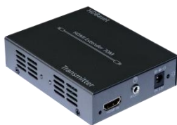
HDMI 转 HDBaset TX 发射器×1