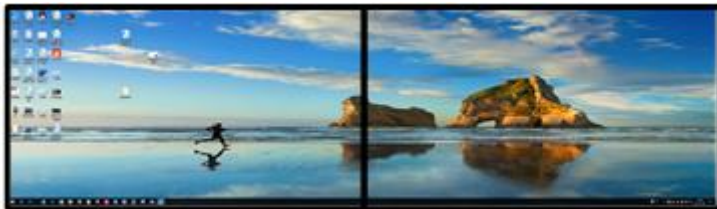
1x2 Model (resolution 3840x1080@60HZ)