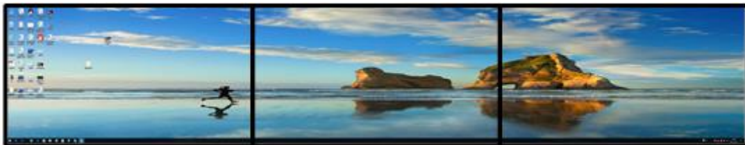
1X3 Model (resolution 5760x1080@30HZ)