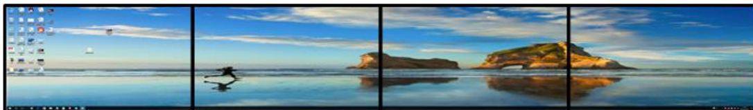
1x4 Model (resolution 5760x1080@30HZ)