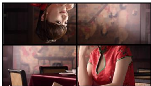
上排液晶屏倒装效果

与普通拼接产品相比，机器具有针对组信号进行 180 度翻转功能。用户在使用普通液晶电视拼接时，对上一排液晶电视翻转 180 度，从而大幅度降低液晶拼接缝隙，减少图像因边缝过大引起的失真，如下图所示：